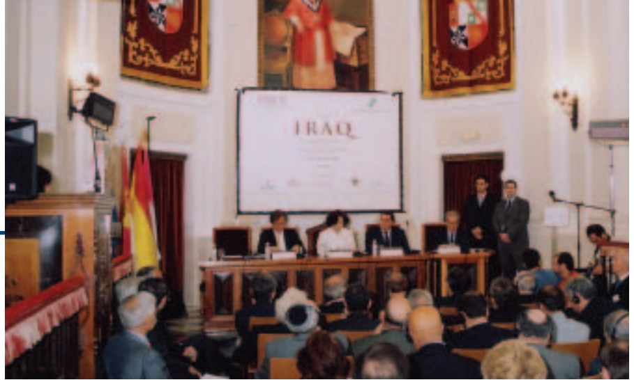
Paraninfo de la Universidad de Castilla-La Mancha en Toledo.

Ministra de Asuntos Exteriores de España