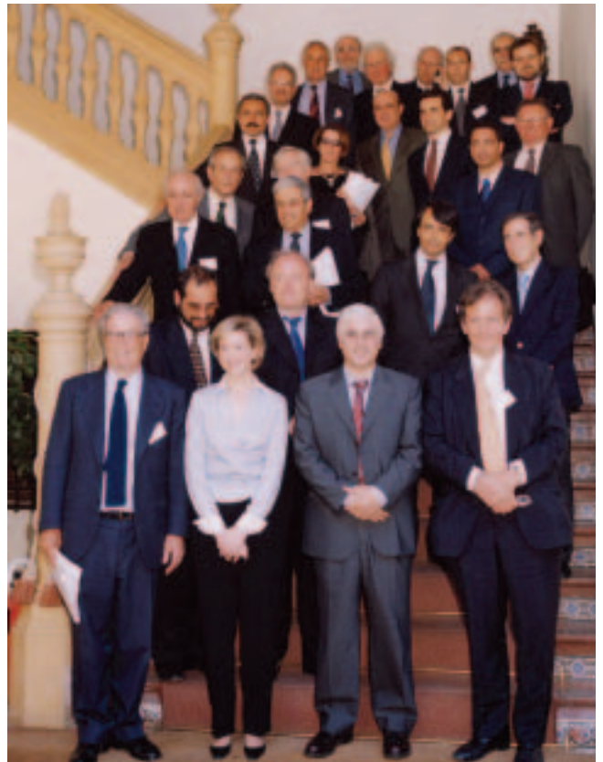
Foto de familia